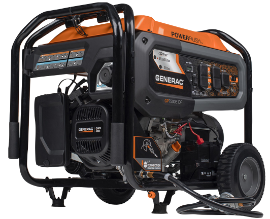
La photographie peut ne pas représenter le contenu réel.

Puissance c.a. nominale de marche (W) 7500 (essence) / 6800 (GPL) Puissance c.a. maximale de démarrage (W) 9400 (essence) / 8500 (GPL)